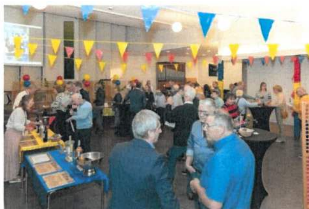
Impressie van wijnproefavond en meer.... op 14-10-2022

Voor het eerst was er de mogelijkheid om in een gezellige koffiehoek een kop koffie, thee of limonade te drinken met.....zelfgebakken Moldavische lekkernijen. Verder waren er door Promoldavie, onze importeur en leverancier, specifieke Moldavische producten neergezet voor de verkoop, ook daar was veel belangstelling voor.