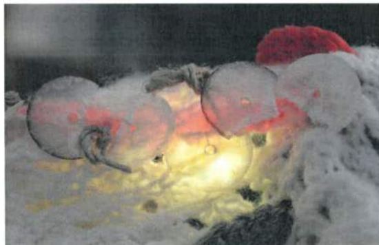
Paasgroetenactie voor Nederlandse gevangenen in het buitenland "Uw licht heelt wat gebroken is"