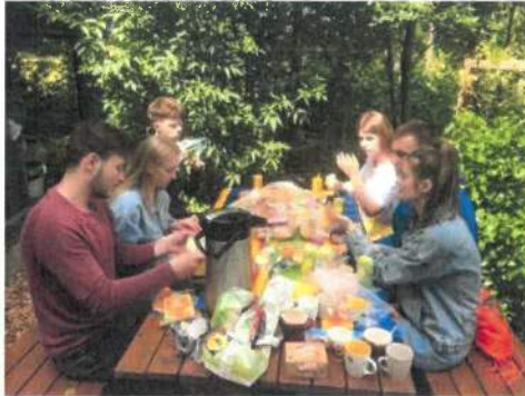
Moldavische jongeren genieten in de Vlindertuin