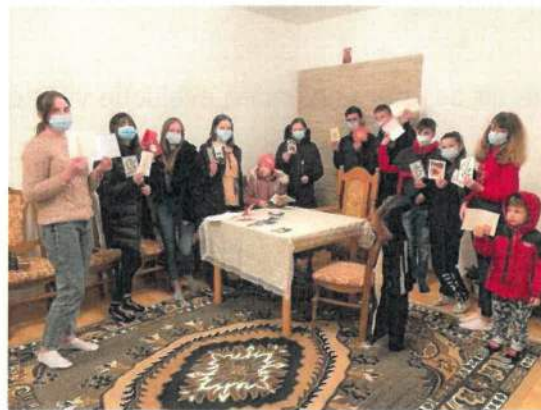
Leusdense kerstwensen ontvangen in dorpen in Moldavië

In 2022 zijn we gestart met ons project: een computerlokaal voor drie dorpen in het noordwesten van Moldavië. Dit project was het eerste specifieke Leusdense project dat wij onder de paraplu van Kerk in Actie mochten uitvoeren.