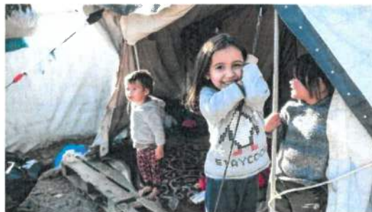
Kerstcollecte voor vluchtelingenkinderen in Griekenland