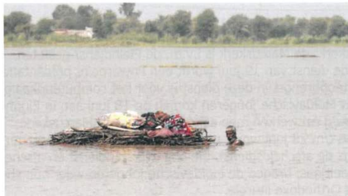
Overstromingsramp in Pakistan