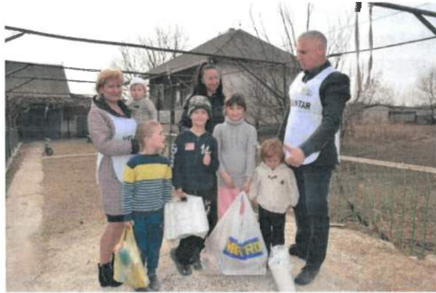
Vrijwilligers van MCA delen voedselpakketten uit aan Oekraïense vluchtelingen