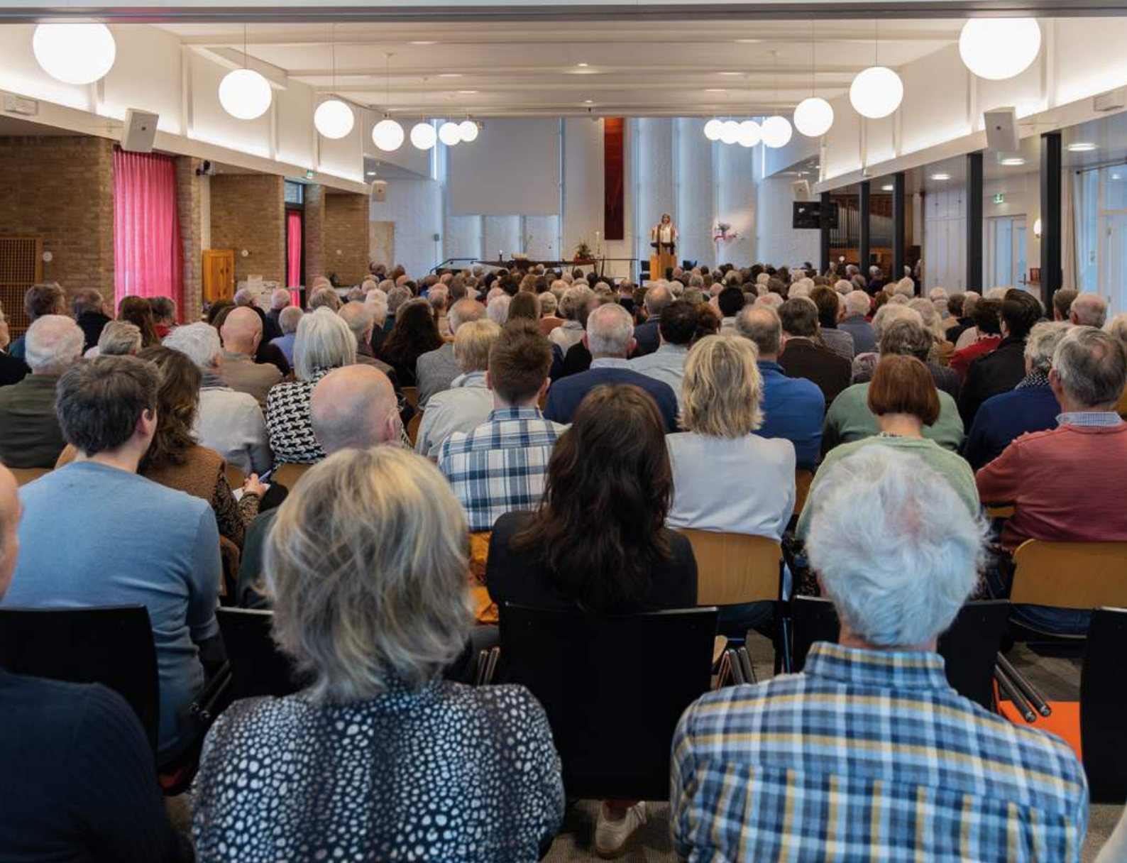
Kerkdienst in de Marcuskerk bij de intrede van dominee Erica.